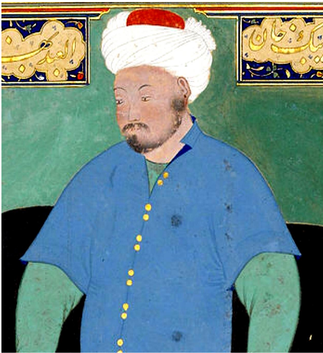
Шайбонийхоннинг Камолиддин Беҳзод томонидан ишланган сурати 1507 йил.